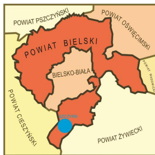
Położenie Szczyrku w Polsce i Powiecie Bielskim

Obszar planu położony jest w Szczyrku, jego południowej części, w rejonie Pośredniego, Soliska, Czyrnej, Małego Skrzycznego oraz części zachodniej stoków Skrzycznego. Obejmuje obszar użytkowany od kilkudziesięciu lat jako ośrodek narciarski, pierwotnie górniczy, obecnie w zarządzie Szczyrkowskiego Ośrodka Narciarskiego.