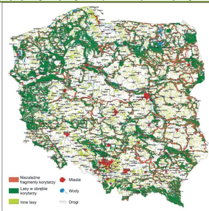
Sieć korytarzy ekologicznych w Polsce opracowana na zlecenie Ministerstwa Środowiska w 2005 r.

W ramach opracowanego w 2007r. w Centrum Dziedzictwa Przyrody Górnego Śląska opracowania „Korytarze ekologiczne w województwie śląskim - koncepcja do planu zagospodarowania przestrzennego województwa – etap I” podkreślono wielką istotę korytarzy ekologicznych jako naturalnych łączników jednostek przestrzennych krajobrazu, umożliwiających przebieg procesów biologicznych oraz spójność sieci siedlisk.